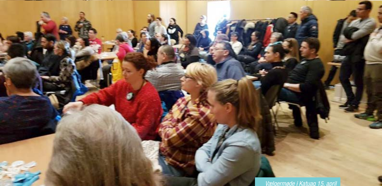
Vælgermøde i Katuaq 15. april