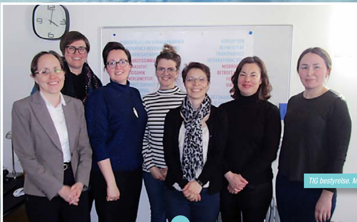
TIG bestyrelse. Maj 2018

Årets resultat udviser et overskud på 93 t.kr. mod et overskud på 4 t.kr. i 2017. Foreningens økonomi hviler dels på medlemsbidrag og dels på donationer fra fonde. I 2018 har GrønlandsBANKEN's Erhvervsfond bl.a. givet 250 t.kr. til understøttelse af projekter og til drift af sekretariatet. De resterende donorer og bidragsydere kan ses længere fremme i rapporten.