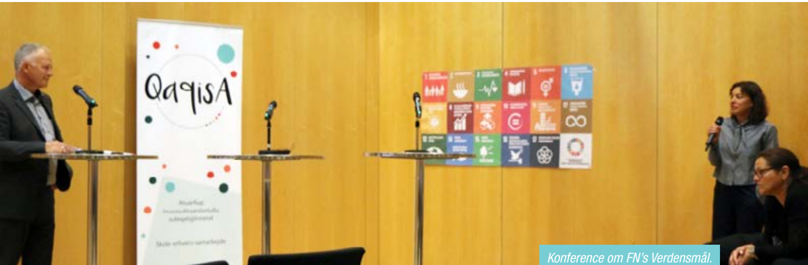
Konference om FN's Verdensmål.