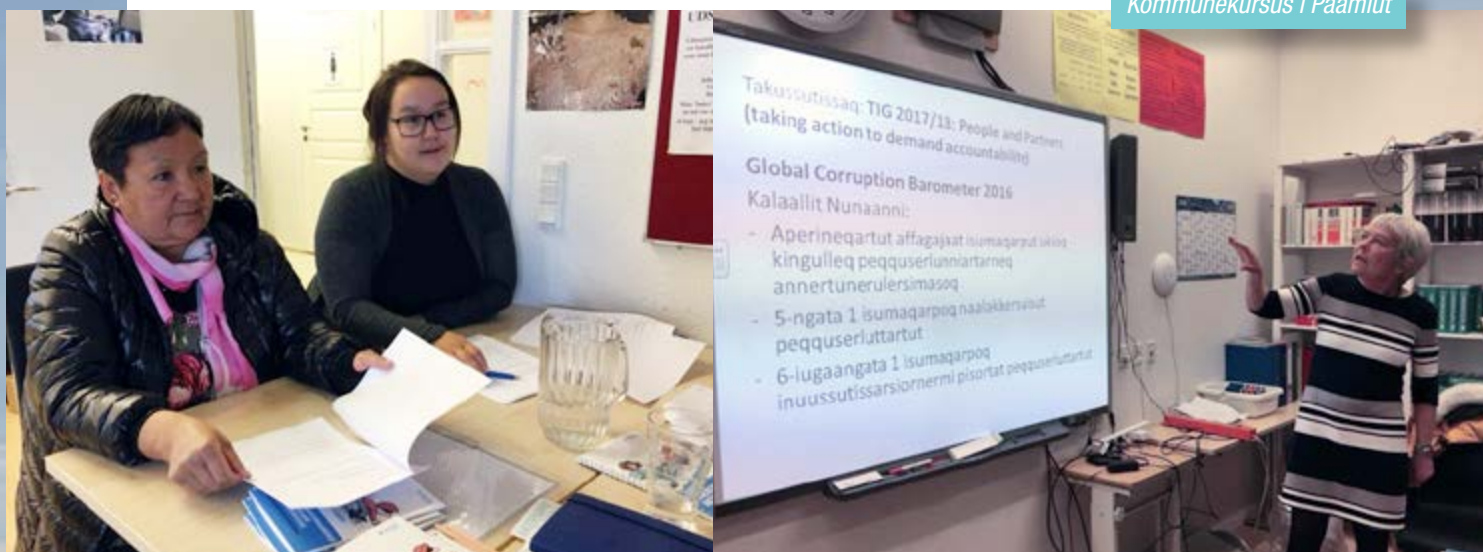
Kommunekursus i Paamiut

Vi mener, at gennem transparens, borgerinddragelse og demokrati kan vi bidrage til Grønlands proces for Nation Building.