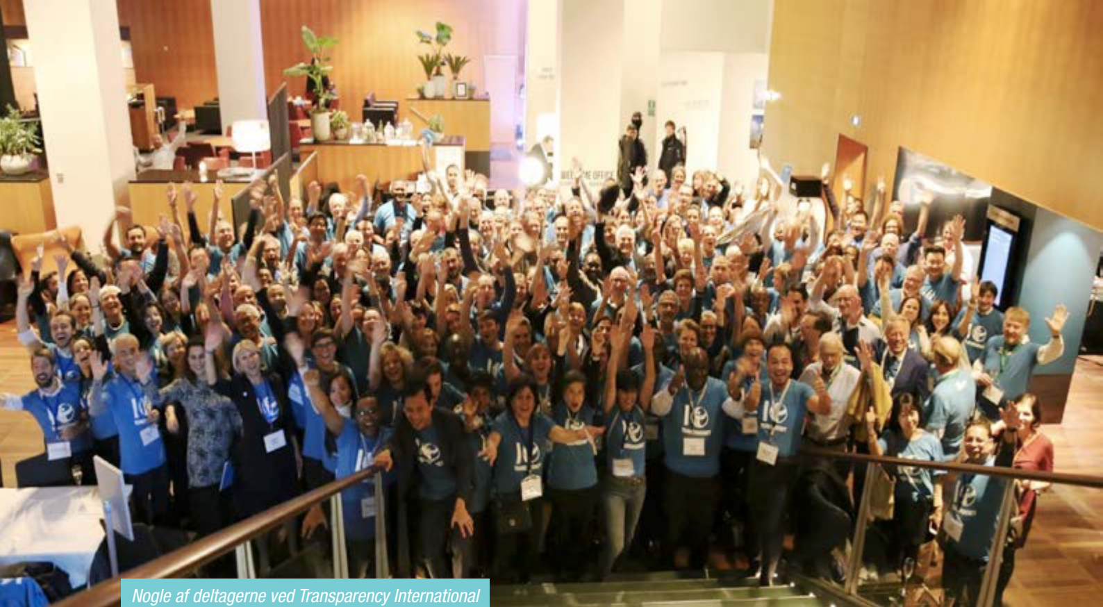
Nogle af deltagerne ved Transparency International 25 års jubilæum og årsmøde