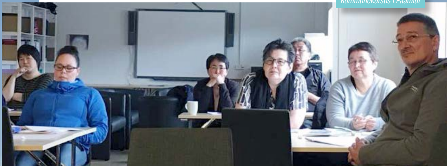
Kommunekursus i Paamiut