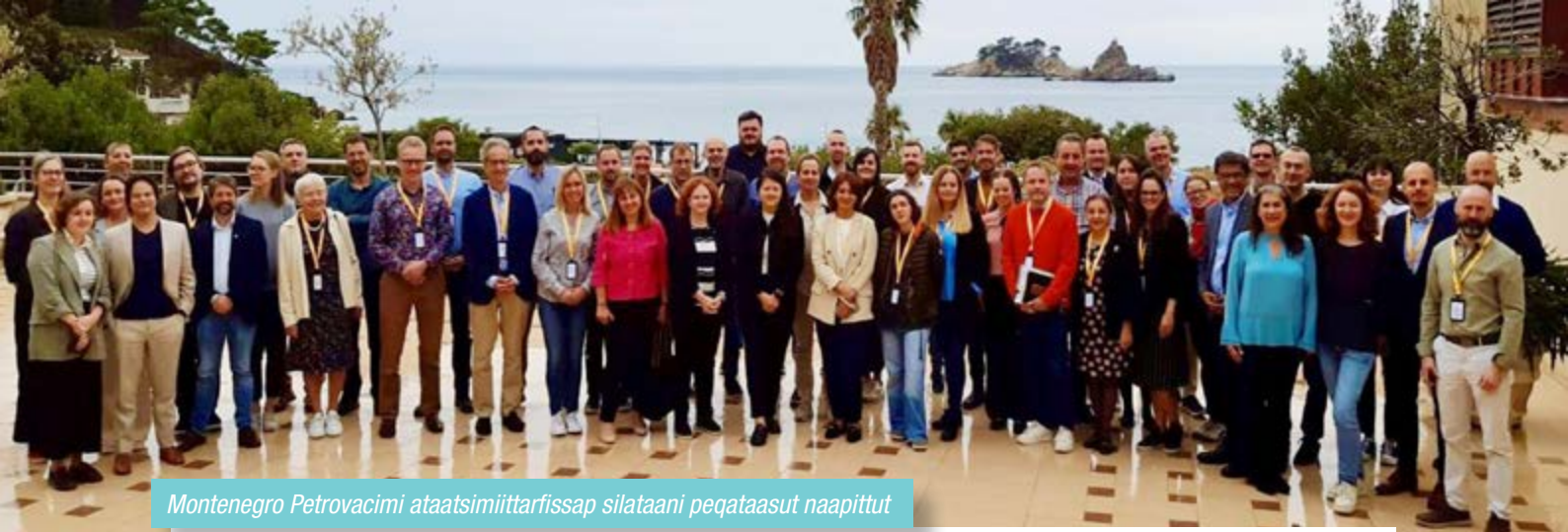
Montenegro Petrovacimi ataatsimiittarfissap silataani peqataasut naapittut