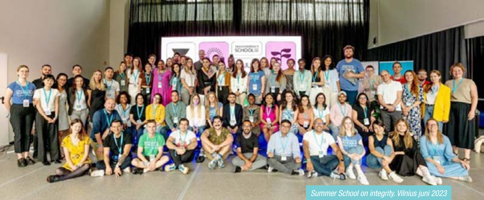
Summer School on integrity. Vilnius juni 2023