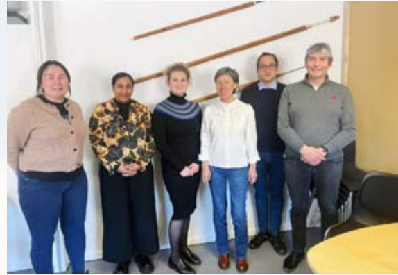
Siulersuisut, april 2023