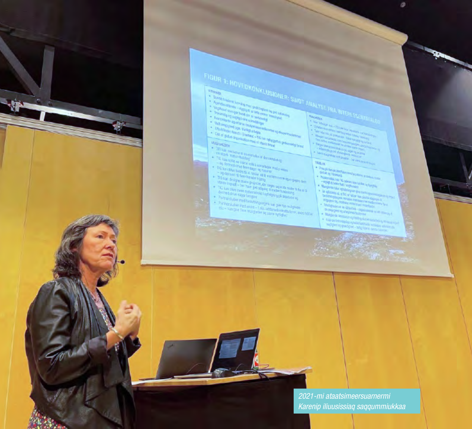
2021-mi ataatsimeersuarnermi Karenip iliuusissiaq saqqummiukkaa