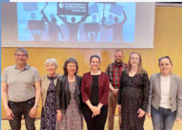
Siulersuisut allaffimmilu pisortaq, april 2021