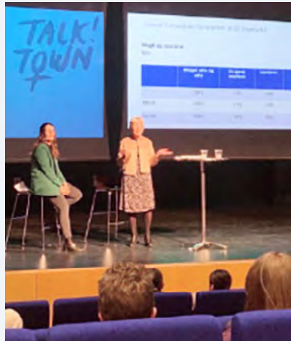
Birita í Dali Bodil Karlshøjlu saqqummiisut.

Nuummi Talk Town aqqiissuummassuk TIG kajumissaar-neqarpoq saqqummiissasoq. Tassani saqqummiukusullugit toqqarpagut kinguaassiutitigut innimittaallortarnertigut kisitsisaatigut Global Corruption Barometerimeersut, sior-natigut saqqummiunneqarnikuunngitsut kiisalu Global Corruption Barometer 2022-miik paasissutissat allat ilanngullugit saqqummiullutigit. Katuami peqataasut apeq-qutissarpassuaqarlutillu – oqallikkumasorpasuupput.