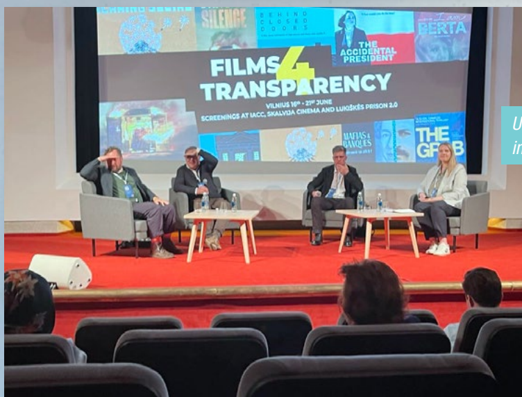
Unge musikere imod korruption