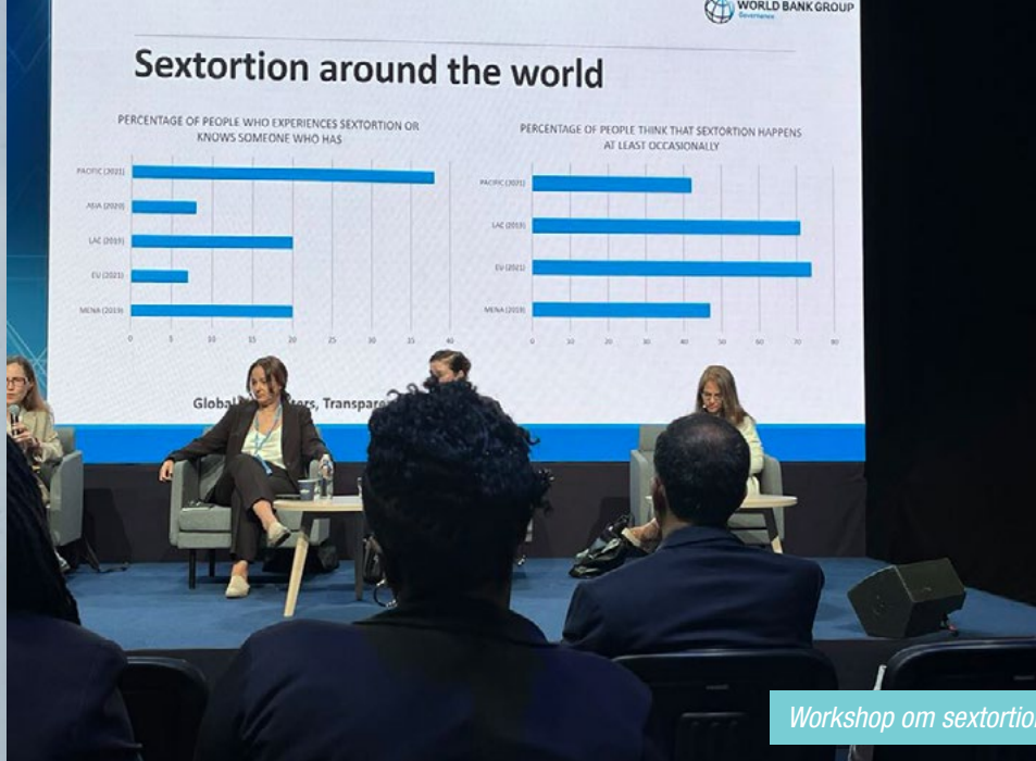
Workshop om sextortion.