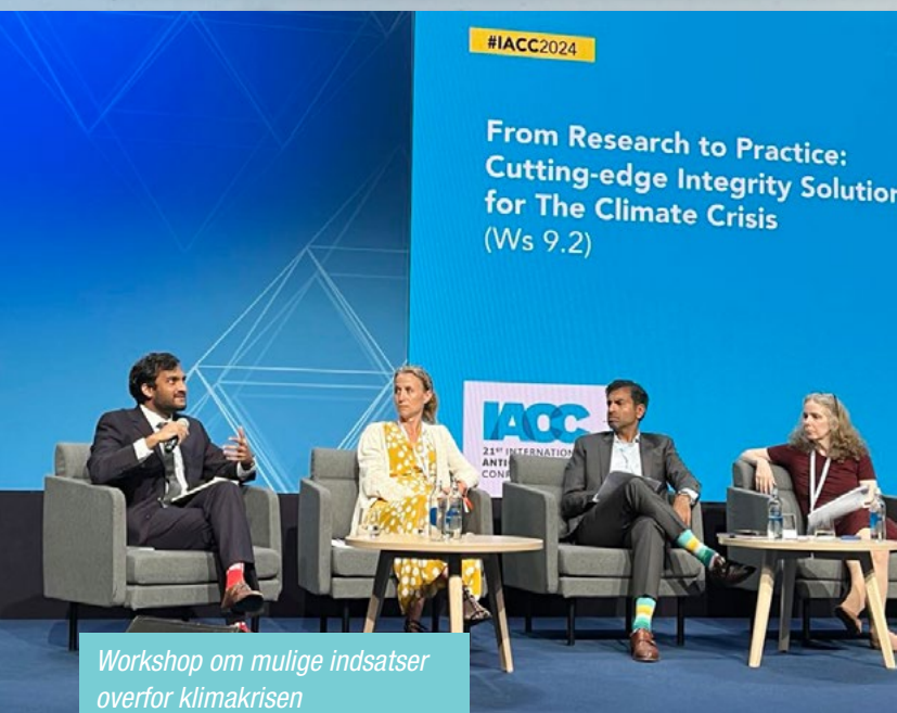
Workshop om mulige indsatser overfor klimakrisen