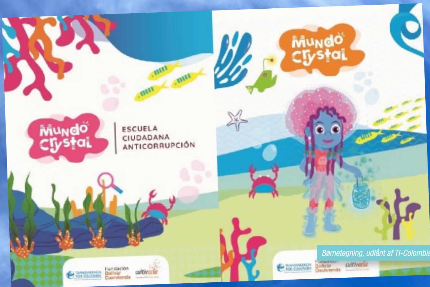
Børnetegning, udlånt af TI-Colombia