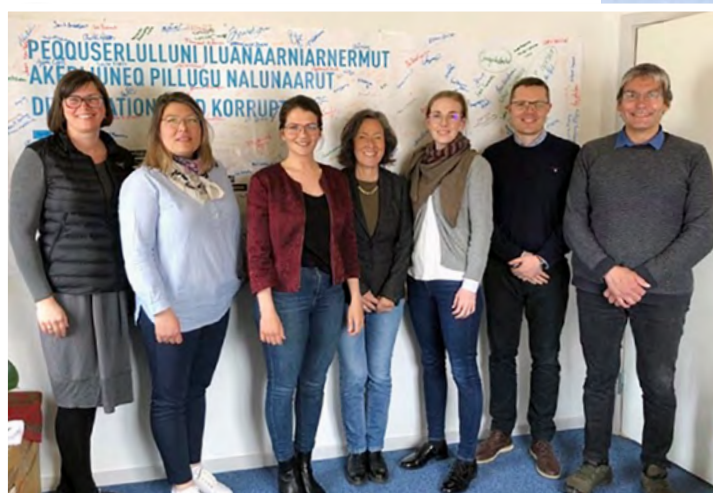
Bestyrelsen, juni 2020

Medlemsantallet i Transparency International Greenland ved udgangen af 2020: 47 personlige medlemmer og 20 virksomhedsmedlemmer.