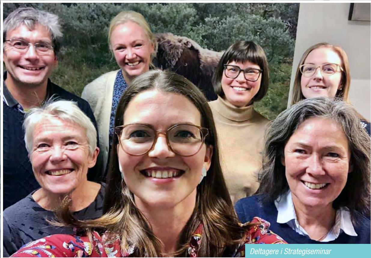
Deltagere i Strategiseminar (bestyrelsen, ekspertmedlem og sekretariat)