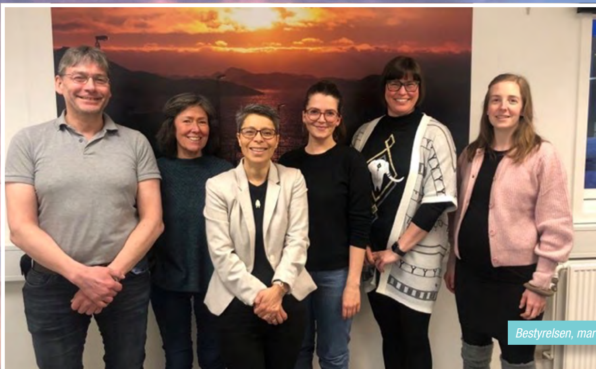
Bestyrelsen, marts 2021

TIG har indleveret 6 høringsvar i 2020. Der har grundet coronarestriktioner ikke været fysisk deltagelse i offentlige møder eller konferencer.