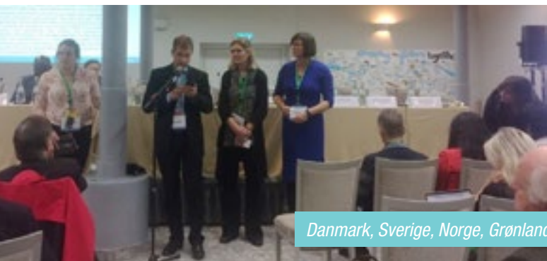
Danmark, Sverige, Norge, Grønland