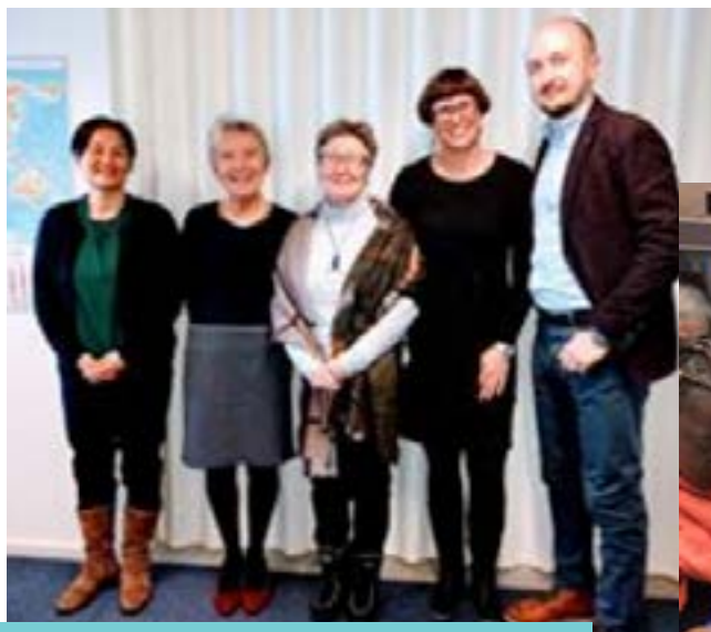
Møde med borgmester i Kommuneqarfik Sermersooq.

Ukiumi angusat 4.tkr.-inik sinneqartoortitaqarput siorna 2016-imi taakku 111 t.kr.-usimallutik. 2016-imilu sinneqartoortaa-sut (taakku iluini illutik 2018-imi ingerlanniakkatut pilersaarutaasu-mut immikkoortinneqarnikuusut 175 t.kr.-usut). Peqatigiiffiup ani-ngaasaqarnerani tunngaviupput ilaasortat tunniuttagaat aammalu aningaasaateqarfinit pissarsiarineqartartut. 2017-imi Grønlands-BANKENip Inuussutissarsiornermut Aningaasaateqarfia ingerlanni-akkatut pilersaarutigineqartunut allattoqarfiullu ingerlannissaanut 250 t.kr.-nik tunniussa-qarpoq.