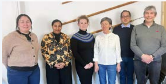
Bestyrelsen, april 2023