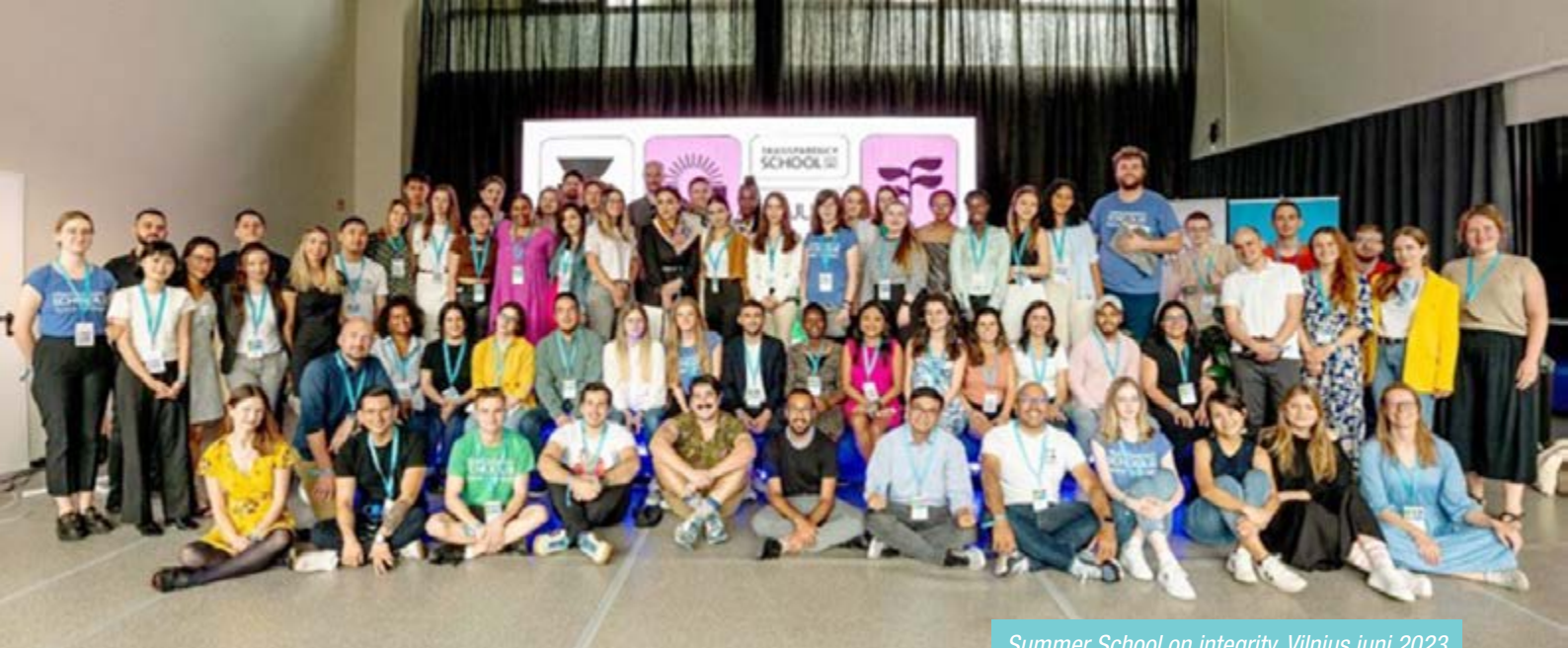
Summer School on integrity. Vilnius juni 2023